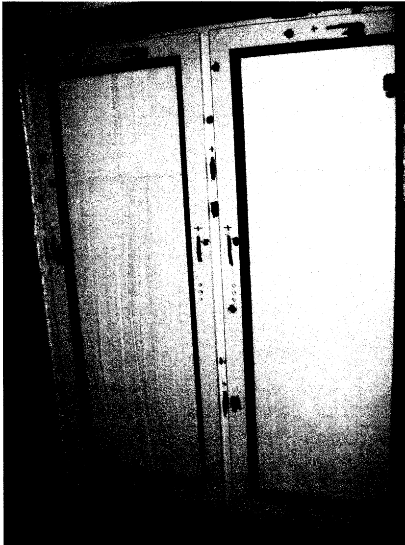
Рисунок 1 - Загальний вид віконної конструкції, що випробовувалась